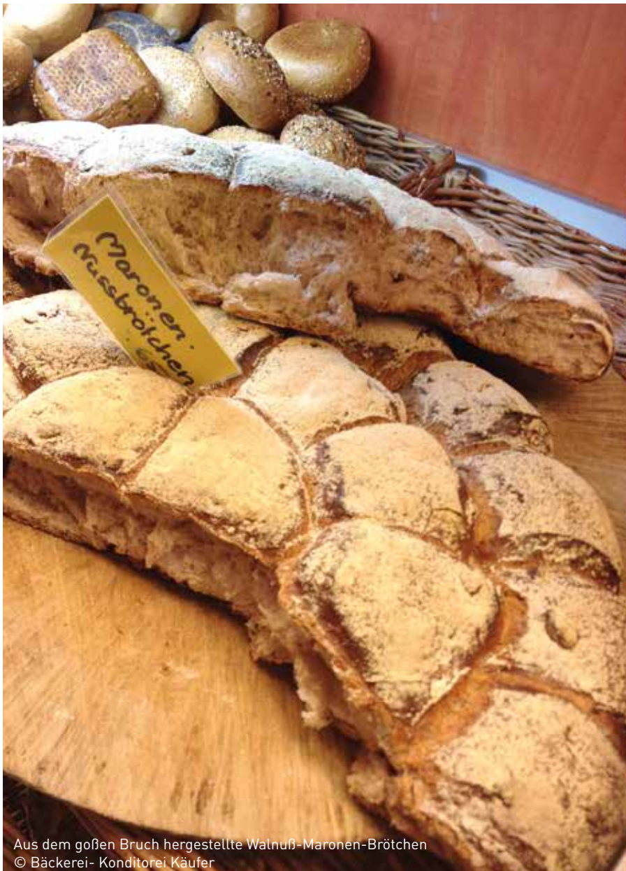
Aus dem großen Bruch hergestellte Walnuß-Maronen-Brötchen

Backprozess hergestellt wurde um mehr Zeit zum Heranreifen zu bekommen, bevor er mit dem Quellstück vermengt wird. „Das dient der längeren Frischhaltung und verstärkt den Geschmack der Maronen“, so Käufer. Von dem hergestellten Brotteig wird anschließend ein Bruch abgeteilt, aus dem Walnuß-Maronen-Brötchen entstehen. Die Brötchen werden direkt vor den Augen der Kunden abgebrochen und dienen insbesondere im November und Dezember zu Mehrkäufen in der Bäckerei.